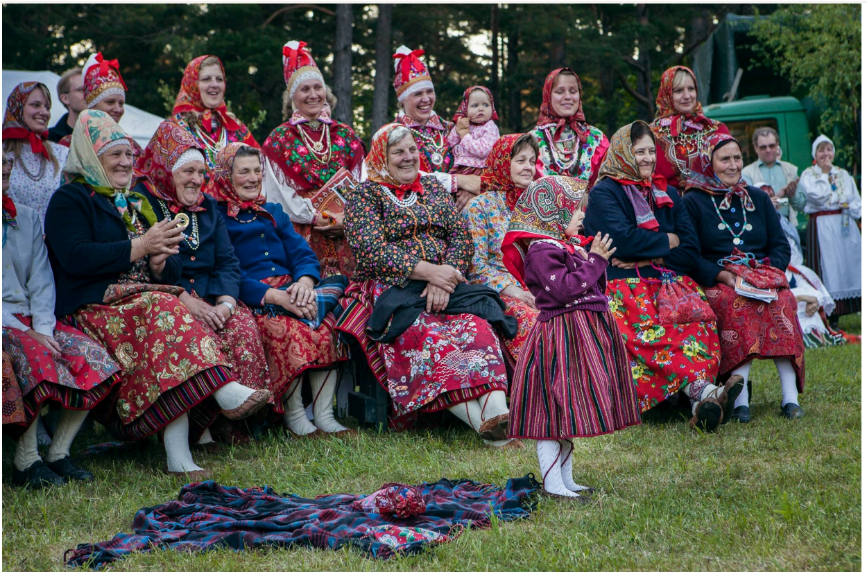
St.Hansaften og alle er pyntet til fest (Kihnu 2009).