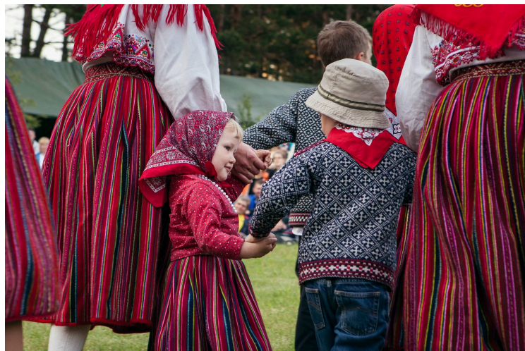
Barna går i lokale folkedrakter og strikketruyer og lærer tidlig å danse (Kihnu 2009).