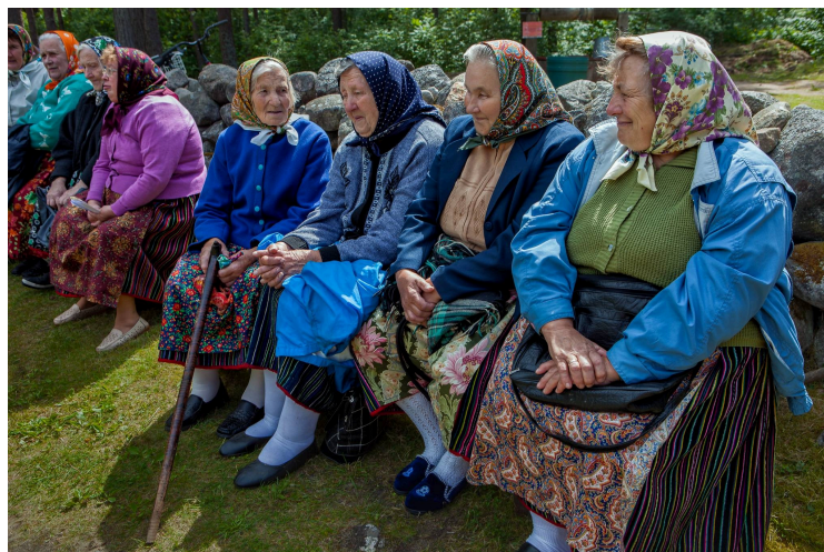
Kvinnene samlet på kirkegården under en slags Allehelgensdag (Kihnu 2009).

Ved alderen seksti starter enhver kvinne prosessen med å lage klær til sin egen gravferd. Hvem som skulle være gravere er bestemt på forhånd, og derfor strikker kvinnen hansker til de utvalgte unge mennene. Man vil passe på at man tar seg godt ut når de ligger i kisten, noe man helt klart kunne se på bildet av den avdøde kvinnen vi fikk se bilde av. Hun lå i åpen kiste på sitt eget kjøkken omringet av kvinner fra landsbyen. Selv om den eldre kvinnen hadde barn med sin store kjærlighet bar hun aldri forkle, dette fordi hennes egen mor hadde nektet henne å få gifte seg med sin utkårede.