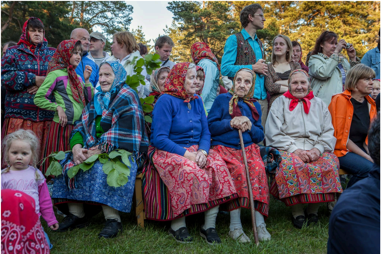
St.Hansaften med turister og de gamle kvinnene i skjønn forening (Kihnu 2009).